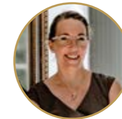
Viola Dreyer Agentur Traumhochzeit

Er ist schon viele Jahre Franchise Partner der Agentur Traumhochzeit und hat schon unzählige Paare bei der Gestaltung ihrer Hochzeit unterstützt, sie als Zeremonienmeister begleitet oder als freier Trauredner die Trauzeremonie gestaltet. Neben seinem eigenen Standort betreut er die weiteren Franchise Partner in Deutschland, Mallorca und Montenegro und ist zusätzlich Ansprechpartner für alle neuen Franchise-Interessenten.